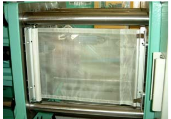
Geeignet für extrem kurze Zykluszeiten und hohe Verfahrensgeschwindigkeiten