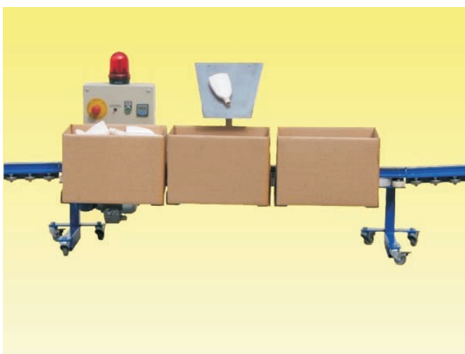
Universal-Befüllgerät mit Kartons

Maße und Gewicht der Gerätes: Standardlängen: 1250 und 1850 mm, Breite: ca. 200 mm + Behältnisbreite, Höhe ist einstellbar, Gewicht: ca. 50 und 60 kg, (Platzsparend beim zeitweiligen Nichtgebrauch).