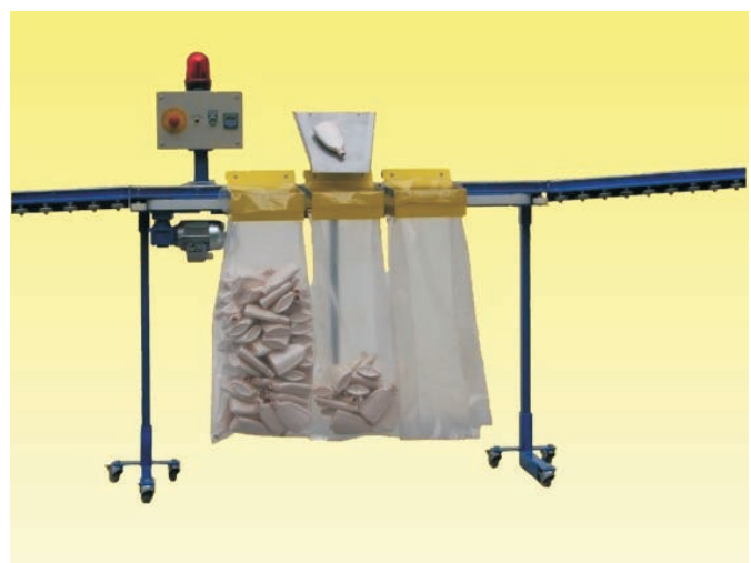
Universal-Befüllgerät mit Säcken

Angaben zur allgemeinen und unverbindlichen Beschreibung des Produktes. Änderungen vorbehalten. Abbildungen ähnlich.